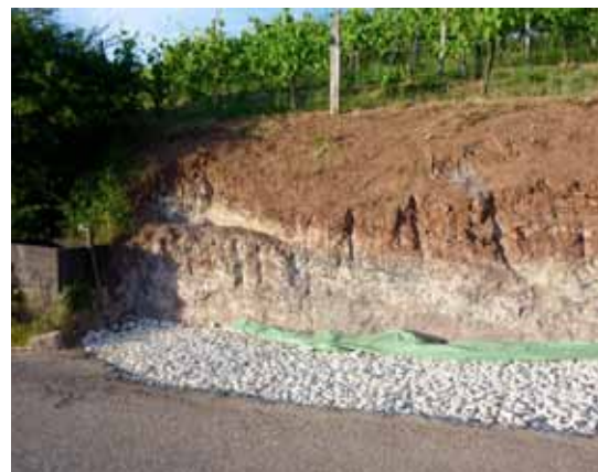
Auf den Schroppen stehen die Fundamentsteine im Trockenem.