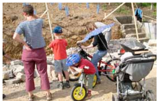
Die Bevölkerung verfolgt den Bau der Mauern mit Interesse.