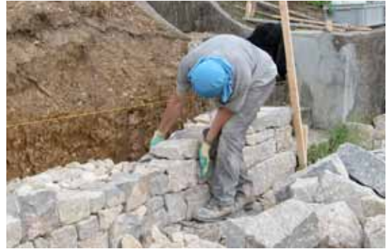
Die Front muss plan sein.