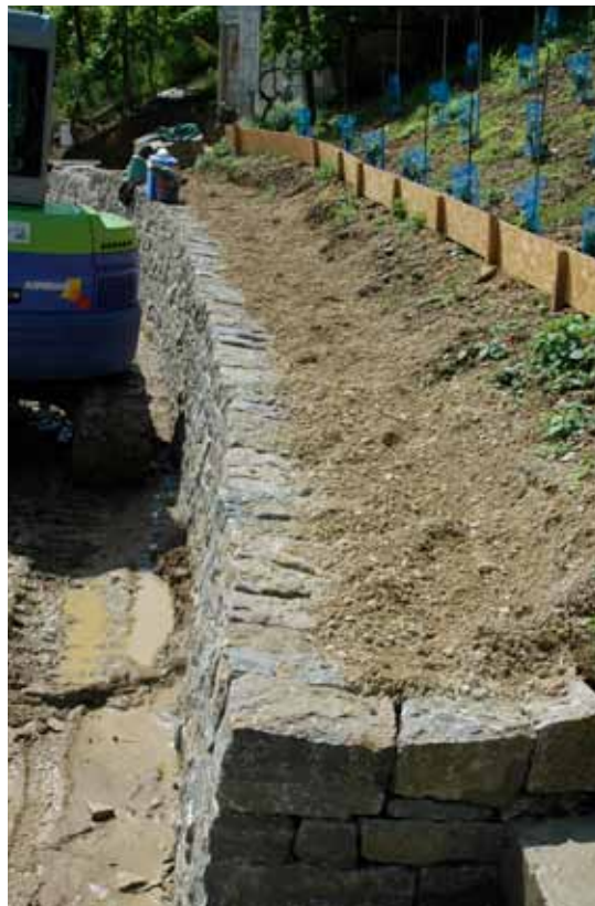
Besenrein muss es sein.