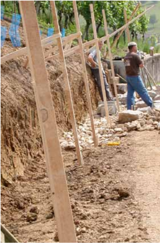
Das Gerüst zeigt den Verlauf der zukünftigen Mauer.