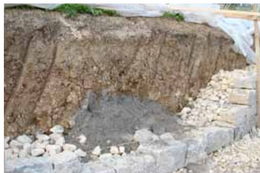
Ein Rückzugsgebiet für Reptilien entsteht.