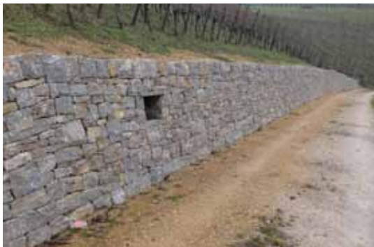
Die Oberflächen der Mauern werden auf Bewegungen untersucht.