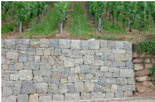
Die Übergänge zwischen alten und neuen Mauern werden beobachtet.

Alle neu erstellten Mauern wurden aufgenommen in ein Inventar der Trockenmauern. Der Zustand der Bauwerke wird jährlich durch einen Fachmann auf allfällige Defekte überprüft. Bei Bedarf können wir schnell reagieren. So stellen wir sicher, dass Mauern und Treppen immer in bestem Zustand bleiben.