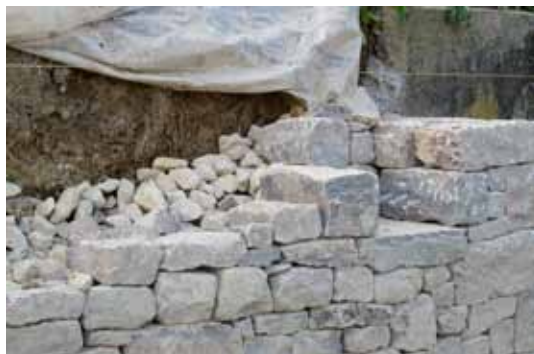
Eine grosse Nische wird ausgespart.

Der VVM ist Mitglied des BL Natur- und Vogelschutzverbands