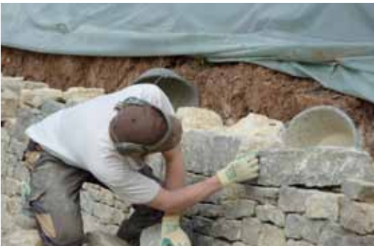
Anzeichnen mit Kreide