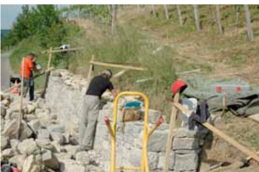
Rampe im Gebrauch