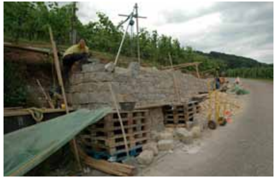
Baugerüst im Gefälle