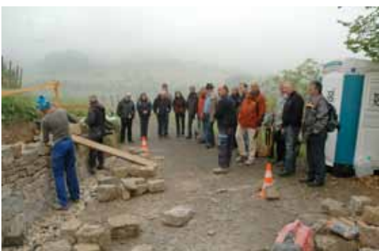
Sponsoren beobachten das alte Handwerk vor Ort.