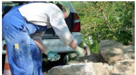
Hammer und Ponciotti-Keile