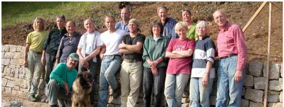
Gruppenbild mit berechtigtem Stolz

Der VVM ist Mitglied des BL Natur- und Vogelschutz- verbands