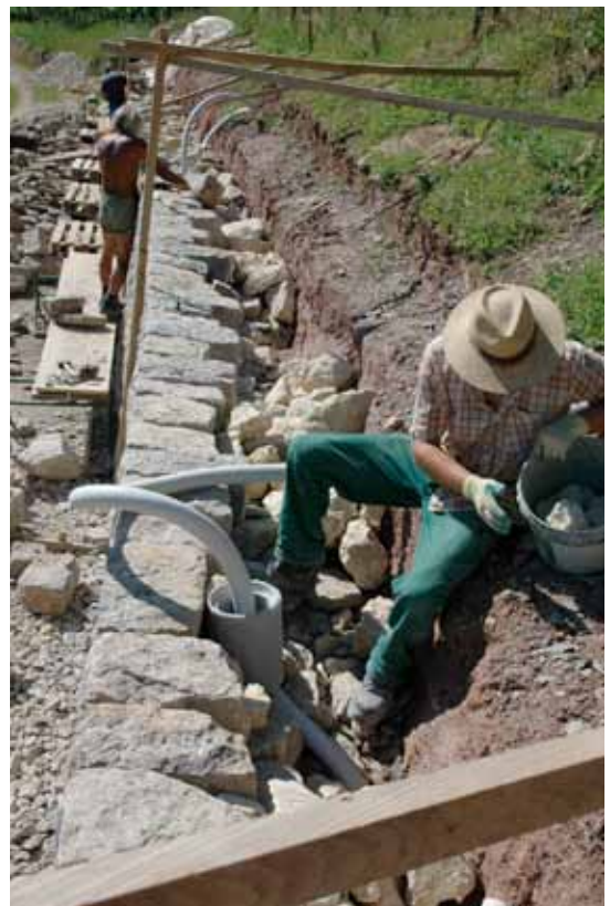
Die Mauerkrone bildet den Abschluss.