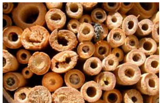
Wildbienennisthilfe mit Besuch

Der VVM ist Mitglied des BL Natur- und Vogelschutz- verbands