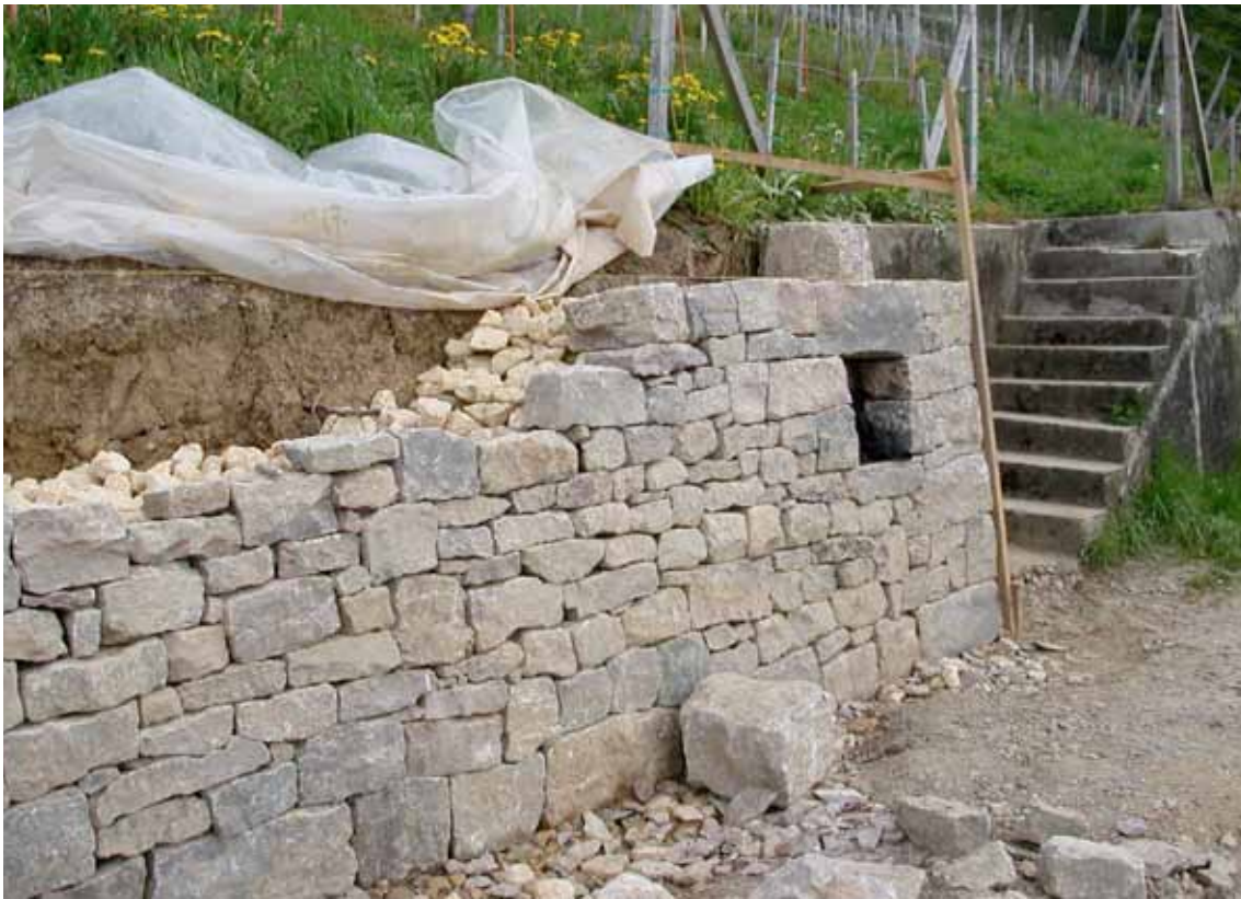
Grössere Nischen in den Mauern werden mit Nisthilfen für Wildbienen gefüllt.