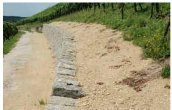
Die Stabilität der Mauerkrone wird kontrolliert.

Der VVM ist Mitglied des BL Natur- und Vogelschutz- verbands