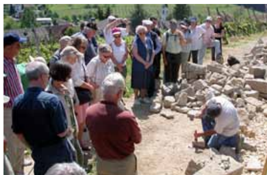
Das Projekt wird einer interessierten Gruppe vorgestellt.