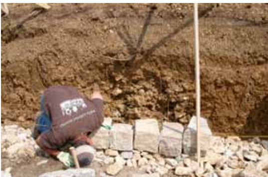
Die Fundamentsteine werden sorgfältig verlegt. Jeder Stein muss sitzen.