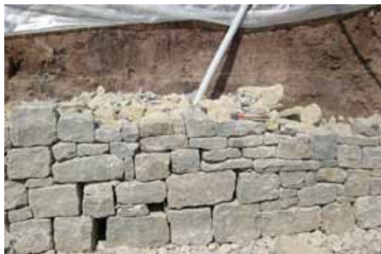
Leerrohre führen von der Mauerkrone zur Igelburg