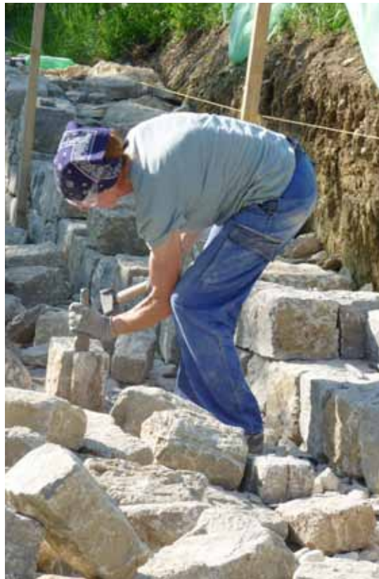
Hammer und Setzer