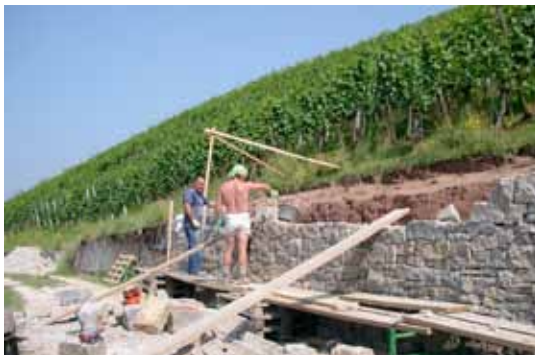
Baugerüst mit Rampen