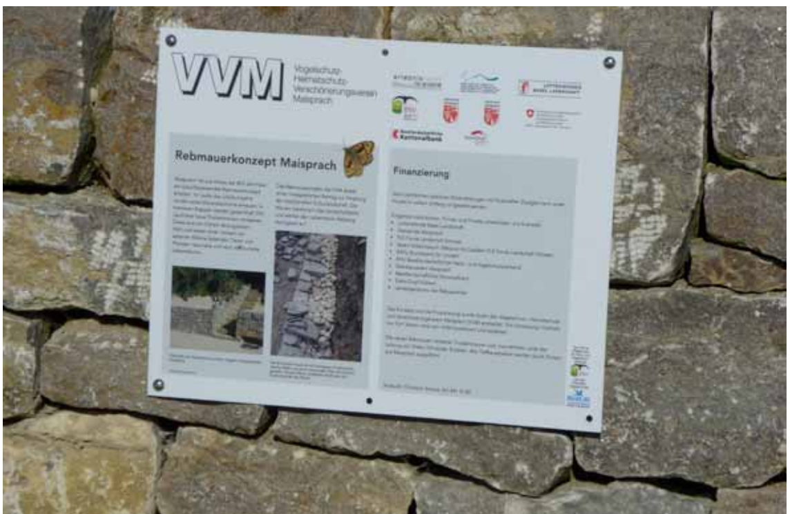
Eine Infotafel orientiert über das Projekt und dessen Finanzierung.