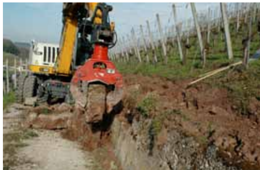
Die alte Betonmauer wird abgebrochen