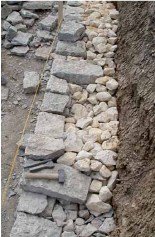
Bindersteine verankern die Mauer nach hinten.