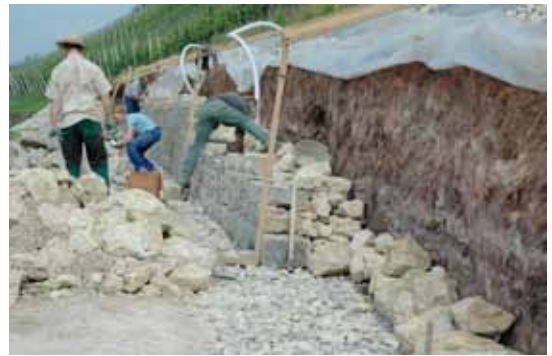
Leerrohre zu Nistnischen werden eingebaut.