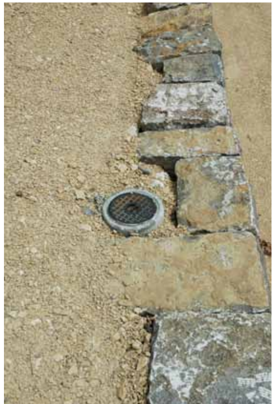
Durch die Leerrohre unter den Schachtdeckeln kann eine Kamera eingeführt werden.