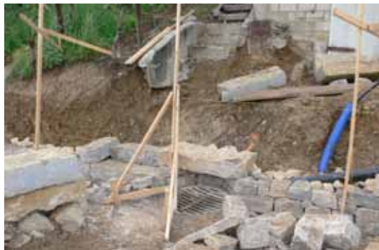
Auch knifflige Situationen werden gelöst.