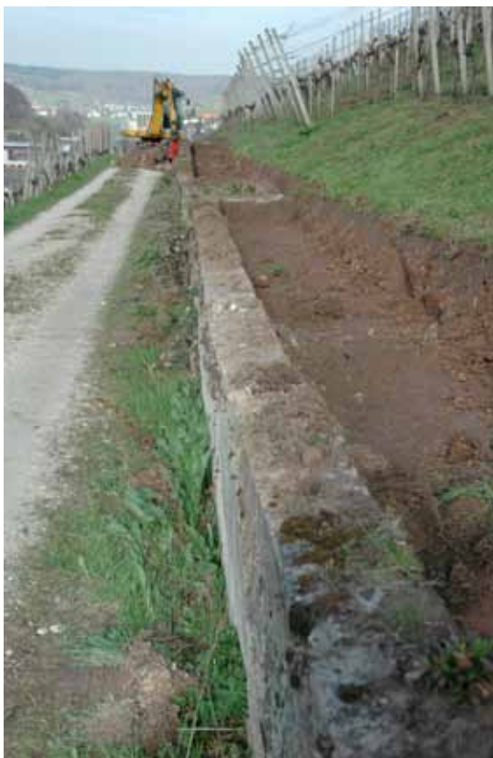
Oberhalb der Mauer wird abhumusiert.