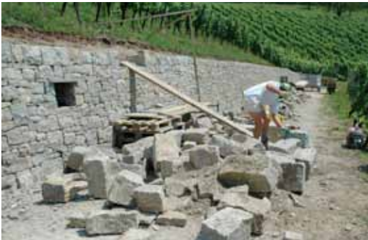
Der Schlussstein wird vorbereitet.