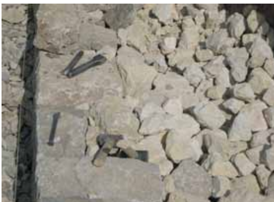
Auch die Hintermauersteine werden einzeln eingebaut, so ist die ganze Packung fest verkeilt.