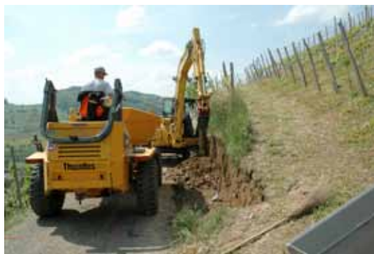
Der Aushub wird präzise ausgeführt, damit die Reben keinen Schaden nehmen.