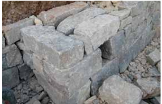
Eine Igelburg ist im Bau.