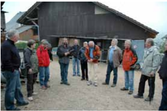
Die Sponsoren werden zu einem Rundgang begrüßt.