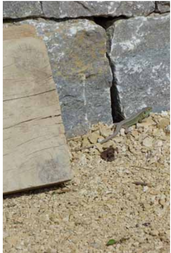
Zauneidechse auf der Baustelle